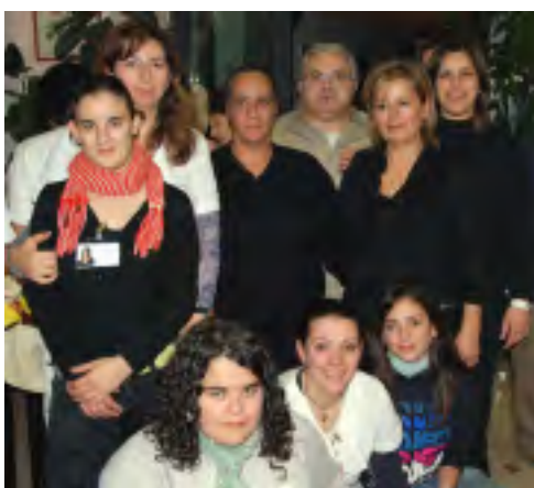
FOSSOMBRONE - Casargento ha ospitato l’iniziativa “Autunno in festa!” ultimo appuntamento del progetto “Paesaggi” realizzato dall’Auser Fossombrone che

ha promosso attività di animazione in diverse case di riposo. Alla simpatica festa che ha riproposto la tradizionale cottura delle caldarroste sul “focone”, contornata da momenti di musica e da assaggi di dolci tipici, hanno preso parte anche gli anziani ospiti delle residenze protette di Acqualagna, Cagli, Cantiano e Saltara oltre a numerosi familiari.