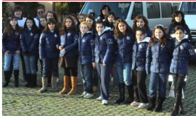
Il 2009 porta una bella notizia: 800 kg. di prodotti alimentari a lunga conservazione sono stati raccolti dalle bambine coadiuvate dai volontari della CRI in occasione di Forum Shopping.

E non possiamo non gioire anche delle emozioni dei “grandi” che, ancora di più in questo momento di grandi insicurezze e di difficoltà economiche, riscoprono il