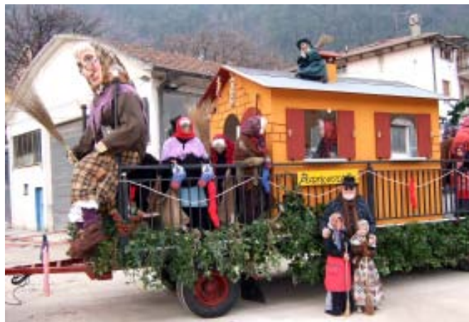
FOSSOMBRONE - Complimenti alla Befana di Piancerreto. Ogni anno più suggestiva. Tanti applausi meritati.