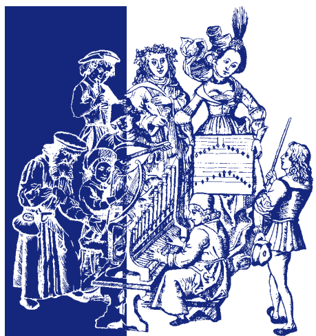
Tipografia Metauro - Fossombrone

Venerdì 23 dicembre 2016 - Ore 21,00 - Chiesa di Sant'Agostino